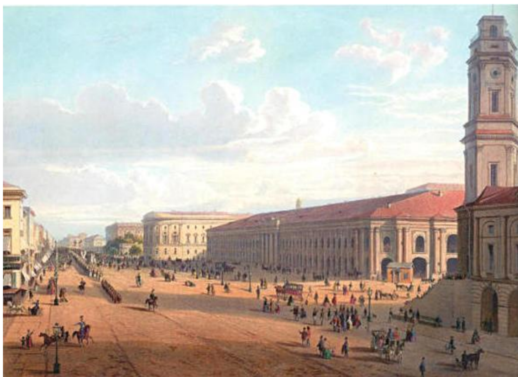
Рисунок 2.1 - Невский проспект в начале XIX века

До приезда в Россию Бетанкур уже был ученым с мировым именем. В России он к тому же раскрылся как педагог и умелый организатор масштабных проектов. Именно ему после войны 1812 года было поручено обустройство Петербурга. Несмотря на недавно исполнившееся столетие, столица Российской империи все еще не соответствовала уровню других европейских городов. Под руководством Бетанкура Невский проспект преобразился в известную нам теперь главную артерию города: были сделаны тротуары, а по вечерам зажигали масляные фонари. Бетанкур хотел установить газовые на менее крупных улицах — Гороховой и Большой Морской, но, как всегда, его идея опередила время и не была воплощена в жизнь.