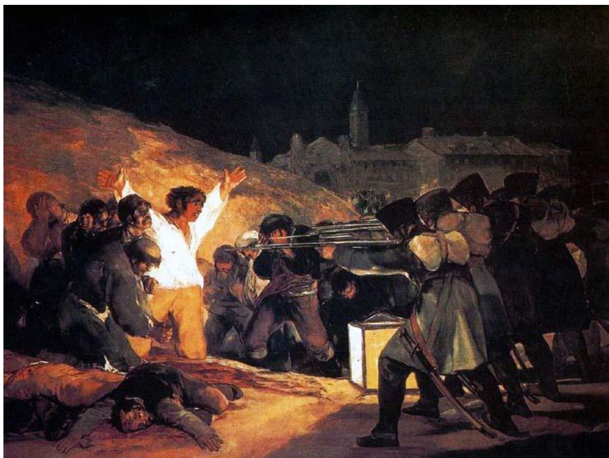
Рисунок 1.1 - Ф. Гойя. Расстрел повстанцев в ночь на 3 мая 1808 года

Остаться в родной Испании для Бетанкура представлялось невозможным. Победным маршем Наполеон шагал по Европе и в 1807 году достиг Испании, королевская династия которой была вынуждена отречься от престола. Однако испанский народ не желал сдаваться давнему заклятому врагу — Франции, и вел одну из самых ожесточенных партизанских войн за всю историю Европы.