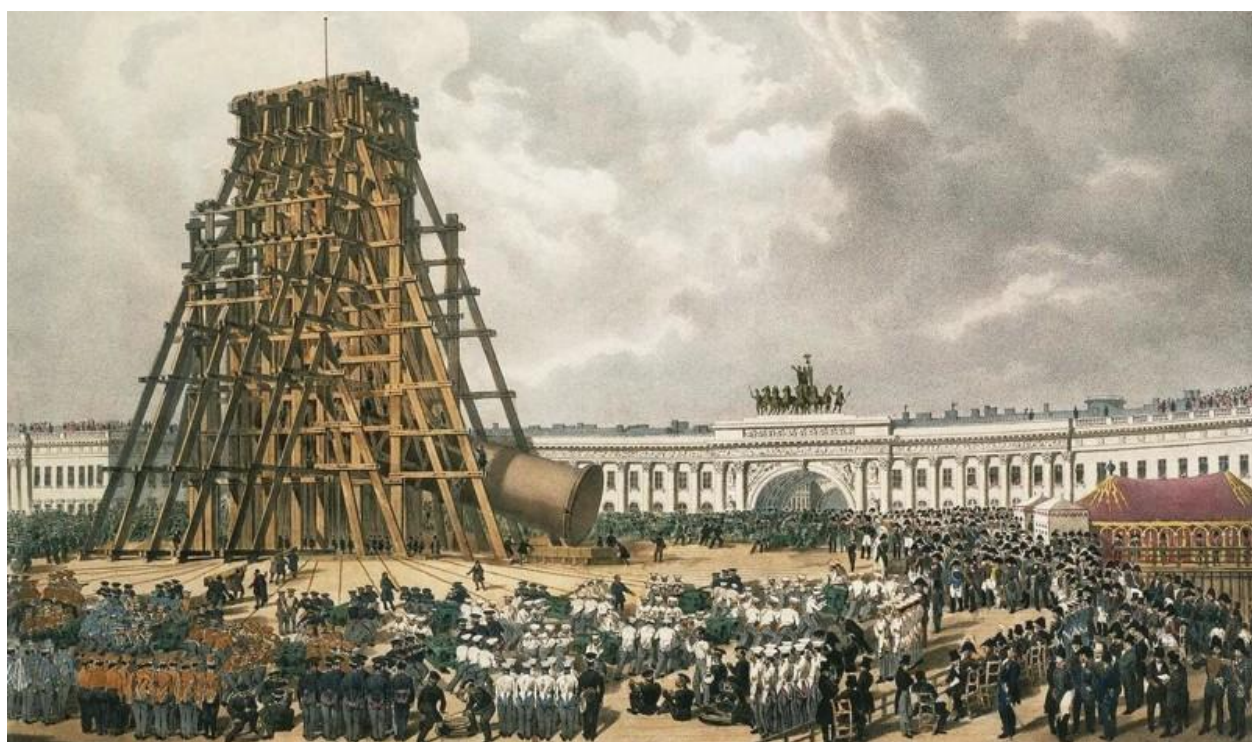
Рисунок 2.2 - Установка Александрийской колонны с помощью механизма Бетанкура

Имя Бетанкура увековечено в создании таких чудес «музея под открытым небом», как Исаакиевский собор и Александрийская колонна. Во-первых, именно он предложил пригласить к работе над обоими проектами молодого и тогда еще мало известного Огюста де Монферрана. Во-вторых, гений инженерной мысли спроектировал подъемную конструкцию, которая позволила установить исполинские элементы Исаакиевской колоннады и жемчужину Дворцовой площади.