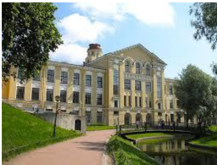
Рисунок 3.1 - Юсуповский дворец на Фонтанке, в котором жил и работал Бетанкур

За первые 10 лет в России Августин Августинович Бетанкур успел хорошо обосноваться. По воспоминаниям современников, худощавый, обладавший небольшим ростом, он любил вкусно поесть, и русские блюда быстро вошли в его рацион. Правда, русский язык он так и не выучил, обходясь распространенным в высшем свете французским. По воскресеньям вместо испанского аперитива он выпивал перед обедом две рюмки водки и любил попариться в русской бане в компании с другим иностранцем — Мартосом, автором памятника Минину и Пожарскому.